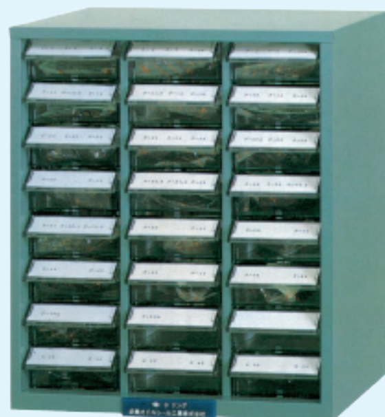
(引出付整理ケース入・引出数24ヶ)