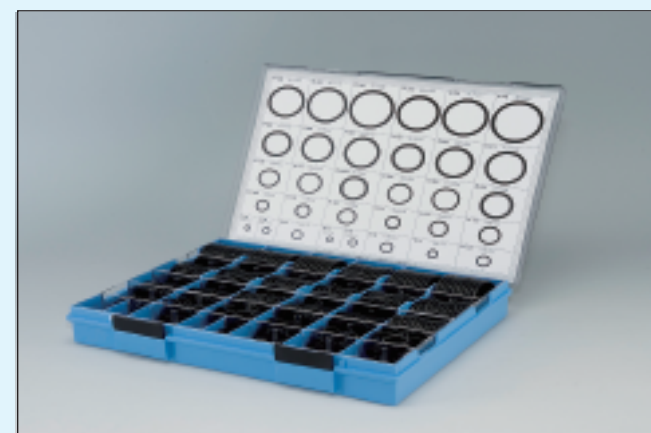
(プラスチックケース入)

-1A 定価 24,000円 -1B 定価 29,000円 -4D 定価 101,000円