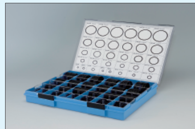
(プラスチックケース入)

-1A 定価 23,000円 -1B 定価 26,000円 -4D 定価 92,000円