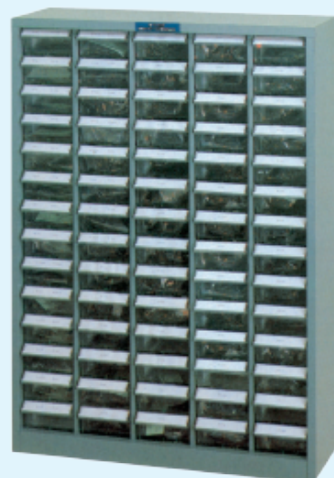
(引出付整理ケース入・引出数70ヶ)