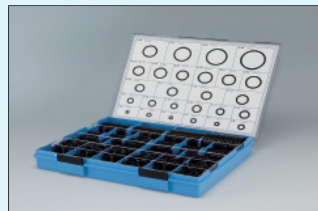
(プラスチックケース入)

-1A 定価 34,000円 -1B 定価 56,000円 -4D 定価 239,000円