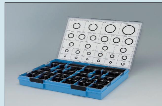
(プラスチックケース入)

NBR-70-1(1A) 定価 37,400円 NBR-90 (1B) 定価 61,600円 FKM-70 (4D) 定価 262,900円