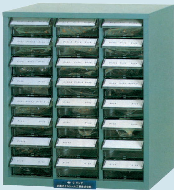
(引出付整理ケース入・引出数24ヶ)