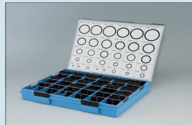
(プラスチックケース入)

NBR-70-1(1A) 定価 26,400円 NBR-90 (1B) 定価 31,900円 FKM-70 (4D) 定価 111,100円