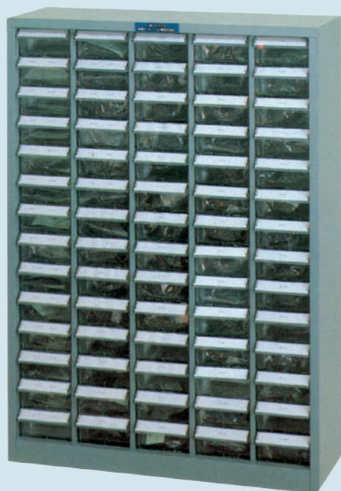
(引出付整理ケース入・引出数70ヶ)